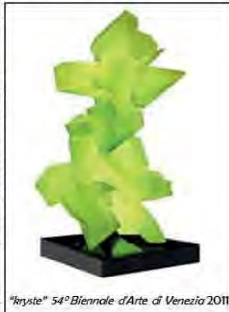
"kryste" 54° Biennale d'Arte di Venezia 2011

hanno sviluppato tecnologie fantastiche, che usate bene da rifugio diventano palco per riappropriarsi del proprio pensiero, e con cui tutti...giovani, anziani, ricchi, poveri... diventano liberi di esprimersi. Rimane il problema di cosa dire... ma fortunatamente ascoltando gli anziani le idee non mancano, e così anche noi giovani possiamo costruire il nostro posto nel mondo.