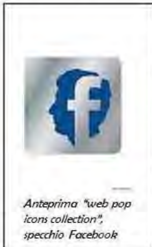
Anteprima "web pop icons collection", specchio Facebook

A.A: Residenza Rivabella intrattiene i suoi ospiti con Art Gallery, Musica, Gastronomia, animazione. Sig. Aleman, come vengono curate tutte queste proposte e come sono recepite dagli ospiti?