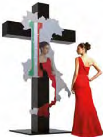
Due opere di Daniele Basso : "L'Italia Splendente di Swarovsky Ma In Croce".

attonito dalla velocità, determinazione e meticolosità con cui è stato cancellato il passato recente. Nuove architetture ottimiste hanno sgretolato anni di dolore. Allora mi chiedo se dimenticare significhi superare? Come possiamo migliorare, se cancelliamo la memoria? In quest'opera ho fatto mio il profilo del muro, metafora di ogni confine, trasformandolo in specchio che ci cattura fino a diventare attori protagonisti costretti a dialogare con la propria coscienza. Un confine invisibile ma concreto, in cui noi diventiamo il limite di noi stessi, riflettendo su pregiudizi, regole e convinzioni che erigono continui muri attorno a noi: appunto muri di specchi! Confini oltre i quali ci sono i nostri sogni e la libertà! Perché l'umanità siamo noi: il muro siamo noi. Poi mi giro e vedo un altro muro nascere..."